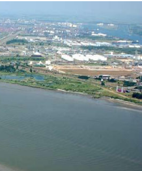
Een uitzicht op de Schelde en het toekomstige tracé van de Liefkenshoekspoor tunnel.