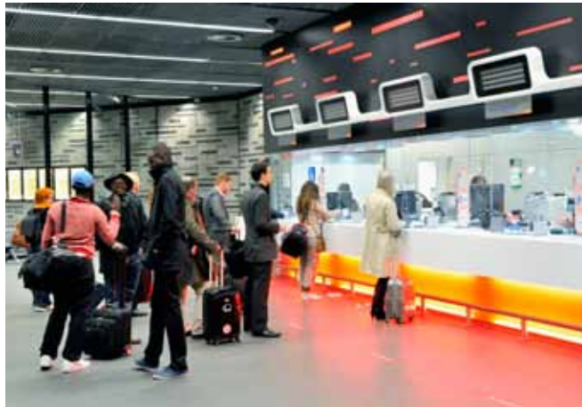
De nieuwe lokettenhal van Brussel-Nationaal-Luchthaven is maar liefst 7 maal groter dan voorheen. Er werd een ruim Travel Centre geopend met 8 gesloten loketten, waarvan een speciaal voor personen met een beperkte mobiliteit.

In de volgende Connect kan je meer ontdekken over de officiële inwijding en de Diabolo Family Day, samen met de beste foto's. ■