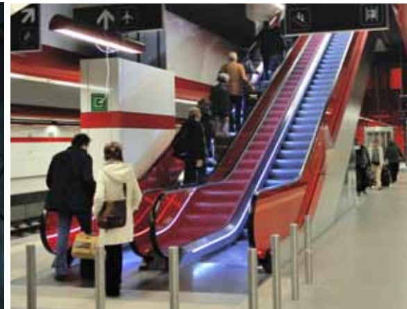
Station Brussel-Nationaal-Luchthaven: de nieuwe trappen en roltrappen zijn nu gehuld in rood transparant glas. Ze verdubbelen de circulatiecapaciteit in het station.

Na bijna 5 jaar is het zo ver! Na jaren van werken heeft Infrabel op 10 juni de Diabolo, de nieuwe spoorverbinding van en naar Brussels airport, commercieel in gebruik genomen. Op 7 juni werd Diabolo bovendien al officieel ingewijd in aanwezigheid van onze koning.