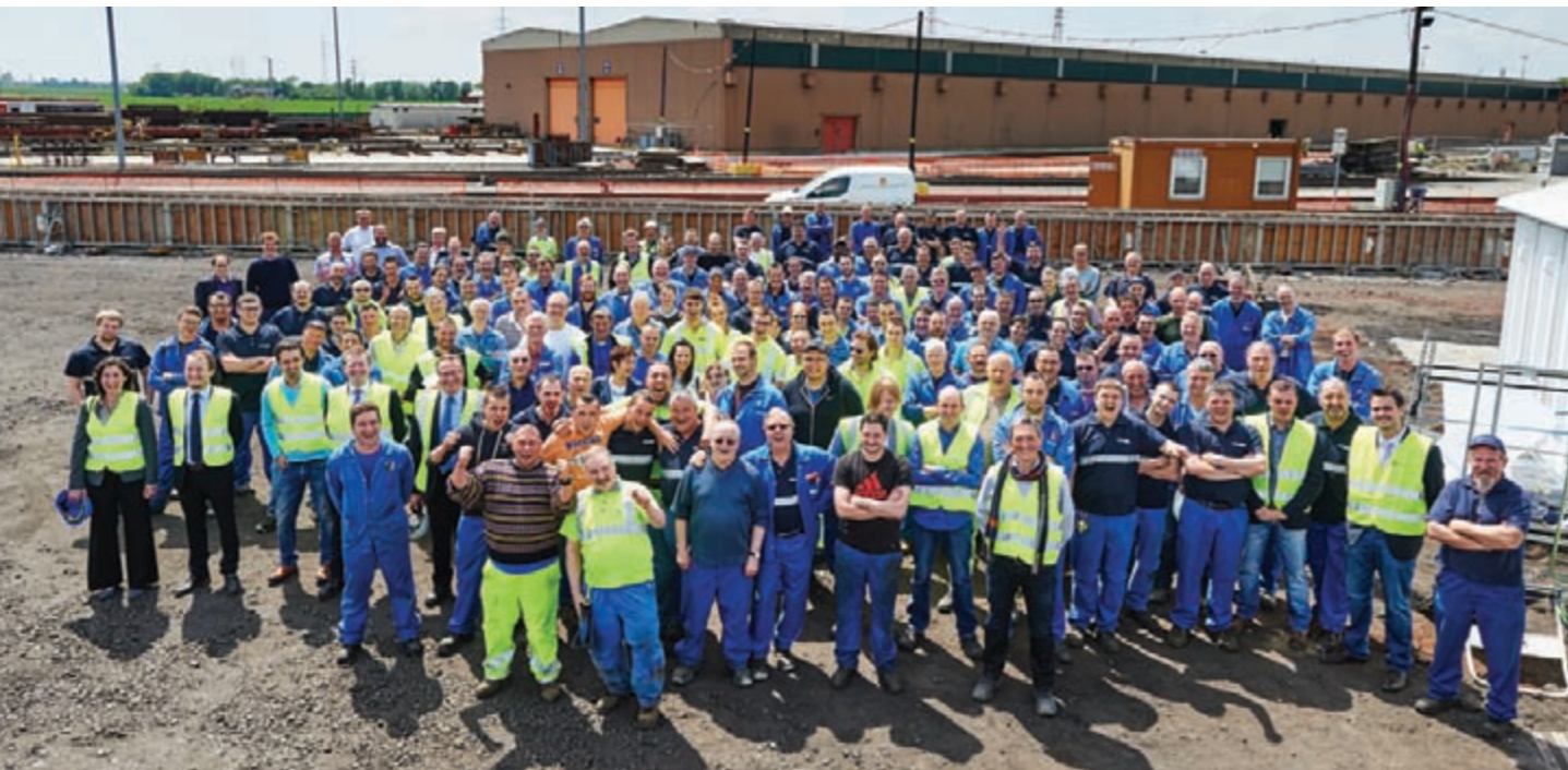
De toekomst van de 267 medewerkers op de site is verzekerd... Allemaal blije gezichten!