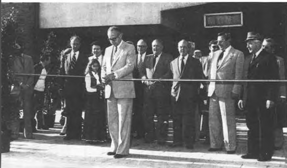
Un coup de ciseaux : le courant passe. Le triangle de la paix : paysage remodelé.