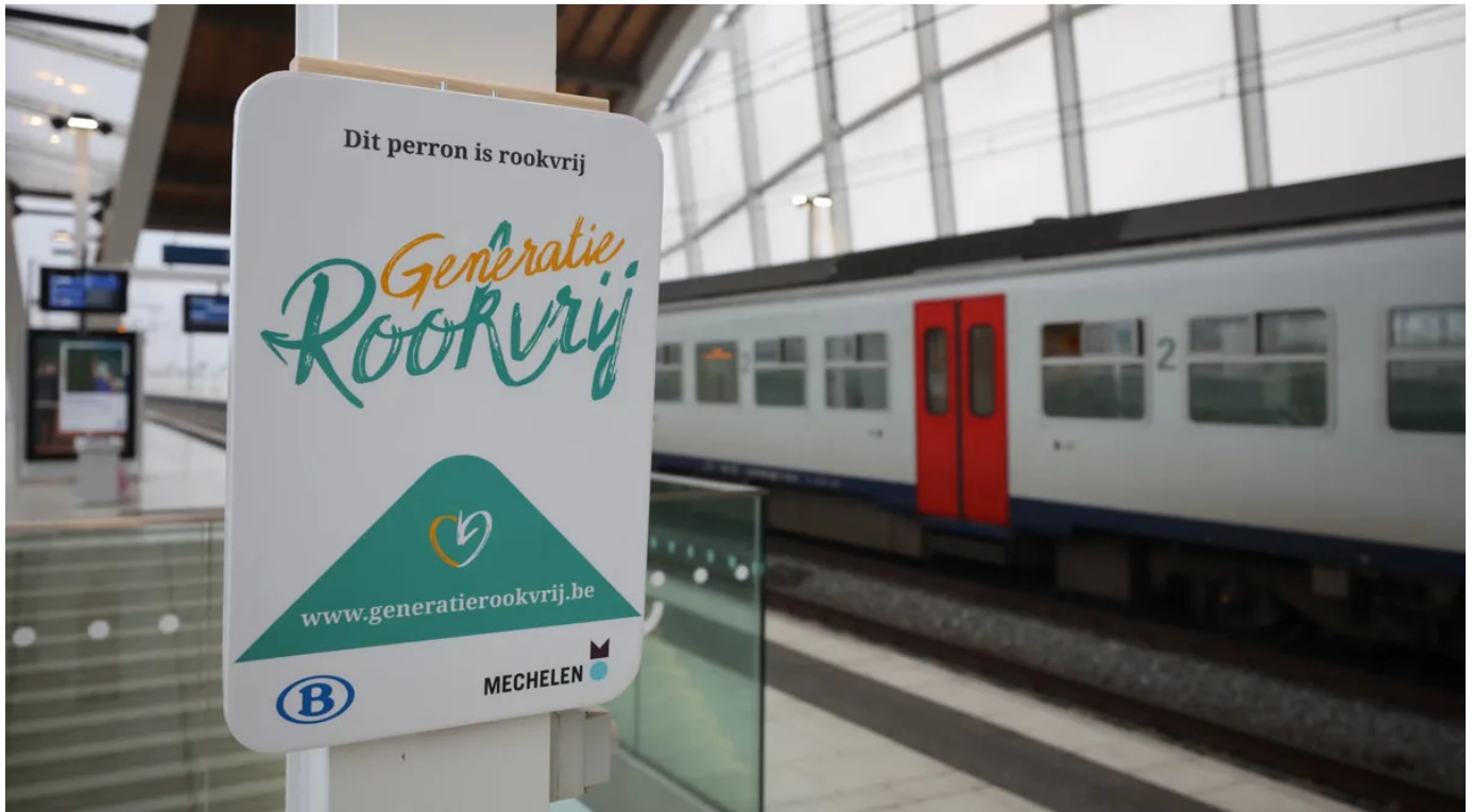
Generatie Rookvrij à la gare de Malines