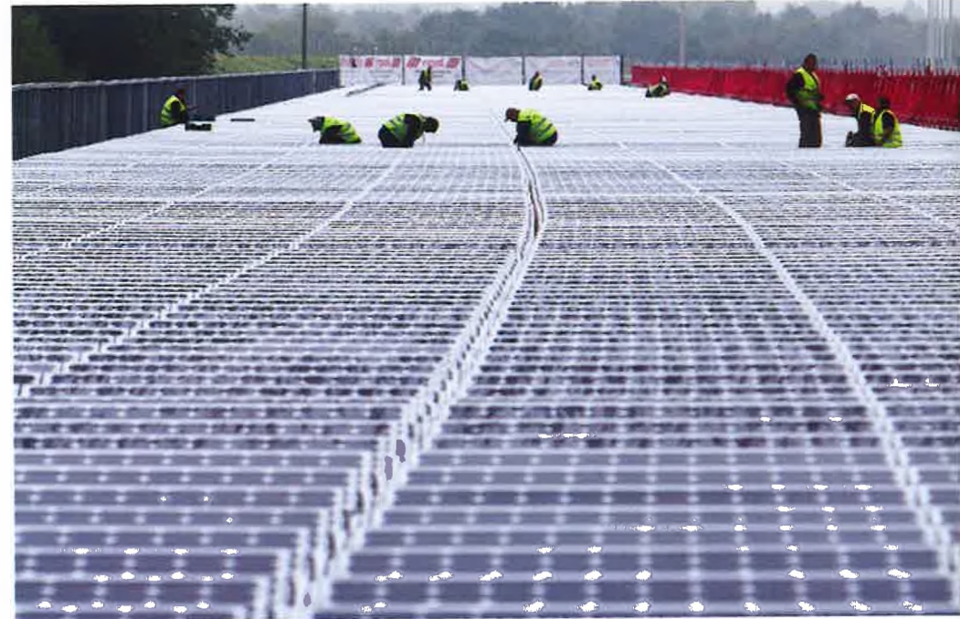
Installation de panneaux solaires sur le toit d'un tunnel de la ligne à grande vitesse au nord d'Anvers

La mobilité durable, développée à partir de nouvelles perspectives et technologies, est notre seule option. Le Groupe SNCB investit donc pleinement dans des projets et des services durables. Voyager en train est en tout cas un choix écologique, mais nous tenons aussi compte du caractère durable lors des investissements dans les gares.