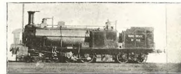
Locomotive à marchandises, Charleroi-Erquelines, 4 essieux couplés, Cockerill 1855, type Enghien.