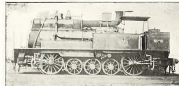
Locomotive à voyag., Mons-Quévy, 2 essieux moteurs indépendants, 4 cyl., sècheur de vapeur. Gouin 1862. Locomotive N. F. affectée à la ligne Mons-Maubeuge-Hautmont.