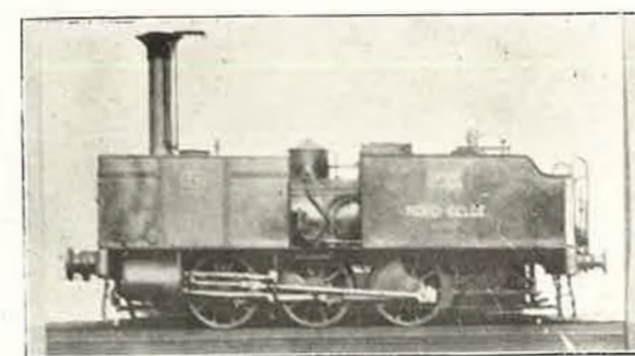
Locomotive de gare, Liège-Givet, 3 essieux couplés, St-Léonard 1856, modifiée à St-Martin en 1862 & en 1872.