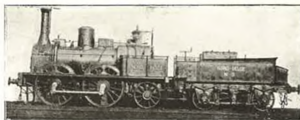
Locomotive à voyag., Liège-Givet, 2 essieux couplés, Cockerill 1849, modifiée en 1858