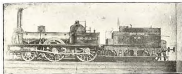
Locomotive à voyag., Liège-Givet, 2 essieux couplés, Derosne & Gail 1846. Stéphenson transformée en mixte en 1850.