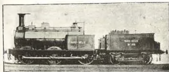
Locomotive à marchandises, Charleroi-Erquelines, 3 essieux couplés, Cockerill 1854.