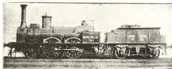
Locomotive à voyag., Liège-Givet, 2 essieux couplés, Cockerill 1850, foyer allongé à St-Martin en 1867.