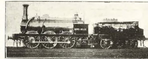
Locomotive à marchandises, Liège-Givet, 3 essieux couplés. Cockerill 1851, modifiée à St-Martin en 1861.