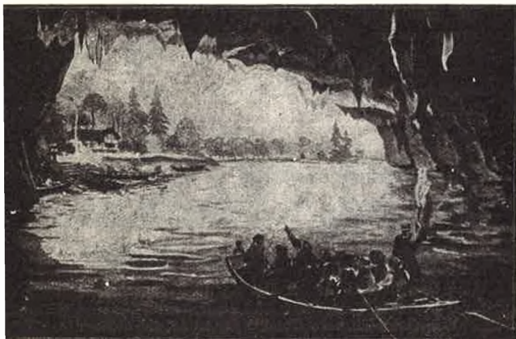
Circuit n° 5. — « La petite Suisse ». Han-sur-Lesse : La sortie des grottes.

Ces prix comportent le coût de l'entrée des Grottes de Han et le parcours en tram panoramique.