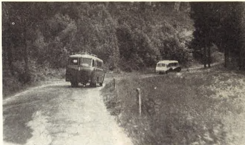
En route pour nos belles Ardennes.