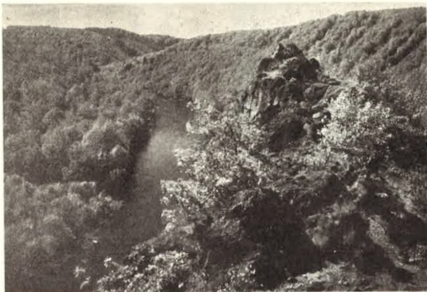
Circuit n° 1. — « La Crête des Ardennes ».

De plus, les membres du personnel enseignant qui accompagnent les élèves bénéficient : d'une réduction de 50 % si le groupe comporte au minimum 10 élèves; d'un billet gratuit pour 15 à 19 élèves; à partir de 20 élèves, d'un billet gratuit par 10 élèves.