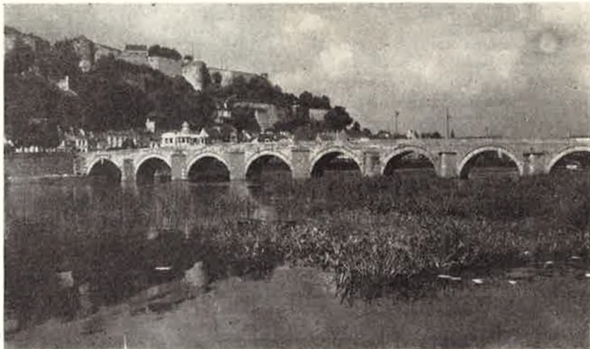
Circuit n° 5. — « La petite Suisse ». Namur : le pont de Jambes et la Citadelle.

Prix du circuit : (y compris le coût de l'excursion en barquette Chiny-Lacuisine et de l'entrée de l'Abbaye d'Orval) groupes : 93 francs (minimum 20 participants) — écoles : 76 francs (minimum 20 élèves).