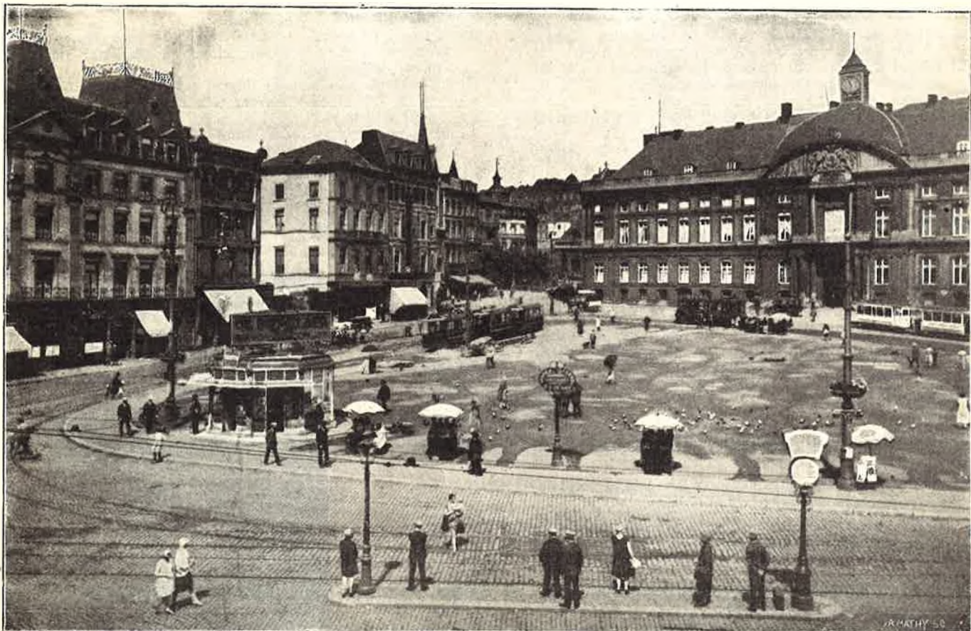
Circuit n° 3. — « Les Belles Vallées ». Liège : La Place St-Lambert