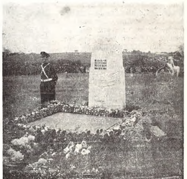
Circuit n° 1. — « La Crête des Ardennes ». Borne terminale du circuit de la Liberté.

50 % dès qu'il est demandé 10 billets. Si le nombre de participants est au minimum de 25, il est fait éventuellement application des prix maxima ci-après, s'il est accompli une distance totale (trajet aller et retour ou parcours combiné) : a) inférieure à 350 kilomètres . . . . . 100 francs b) de 350 à 374 kilomètres . . . . . 108 » c) de 375 à 400 kilomètres . . . . . 116 » d) de plus de 400 kilomètres . . . . . 125 »