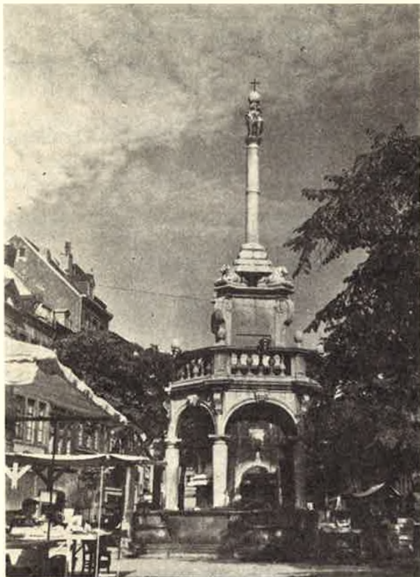
Circuit n° 3. — « Les Belles Vallées ». Liège : Le Perron.