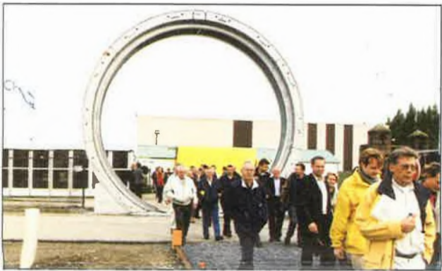
De buurtbewoners van het Damplein werden uitgenodigd om het boorschild zelf te komen ontdekken.