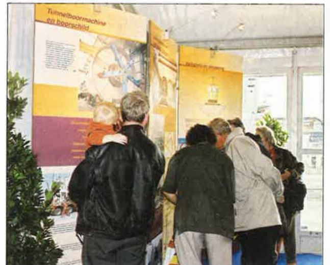
Via expopanelen werd de werking van het boorschild aan de buurtbewoners uitgelegd.