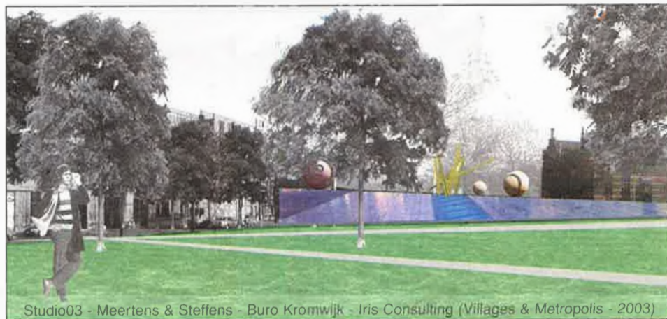
Studio03 - Meertens & Steffens - Buro Kromwijk - Iris Consulting (Villages & Metropolis - 2003)

De tunnelsleuf kan mogelijk worden verpakt als een groene helling of een soort van sculptuur. Het kan een bijzonder decor worden voor uiteenlopende activiteiten zoals openluchtspektakels, festivals, enz. Het dak van de tunnel biedt de mogelijkheid voor terrasjes of tentoonstellingen.