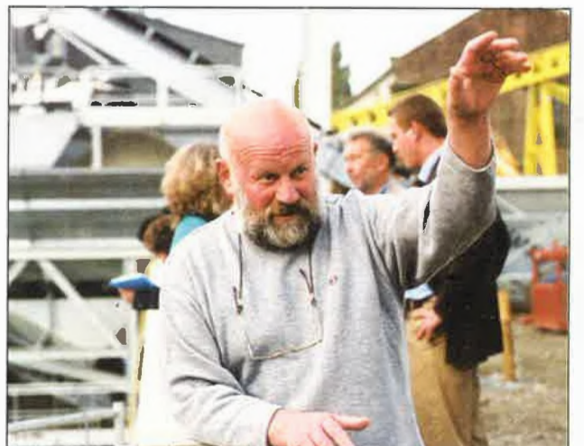
De buurtbewoners waren onder de indruk van de reusachtige tunnelboormachine.