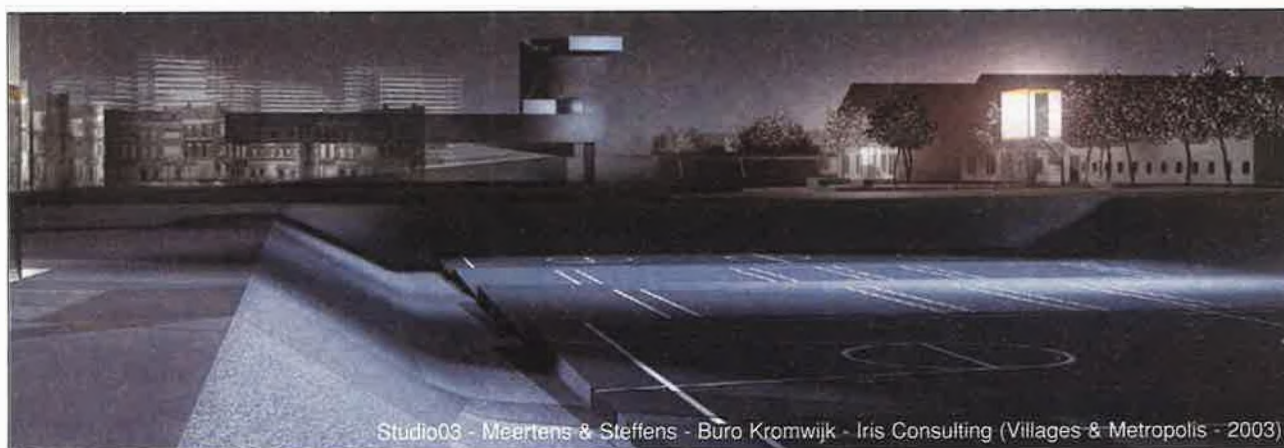
Studio03 - Meertens & Steffens - Buro Kromwijk - Iris Consulting (Villages & Metropolis - 2003)

De site van het vroegere spoorwegemplacement wordt omgevormd tot een landschapspark met ruimte voor projectontwikkeling en recreatie.