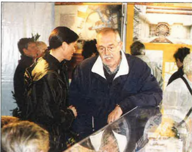
In de tent werd nog druk nagekaart over de start van de boorwerken.