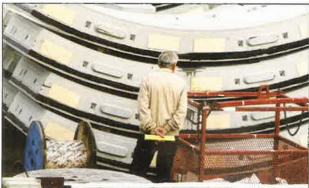
In totaal zullen 13.000 tunnelsegmenten van ongeveer 5 ton worden gebruikt voor de realisatie van de tunnelkokers.