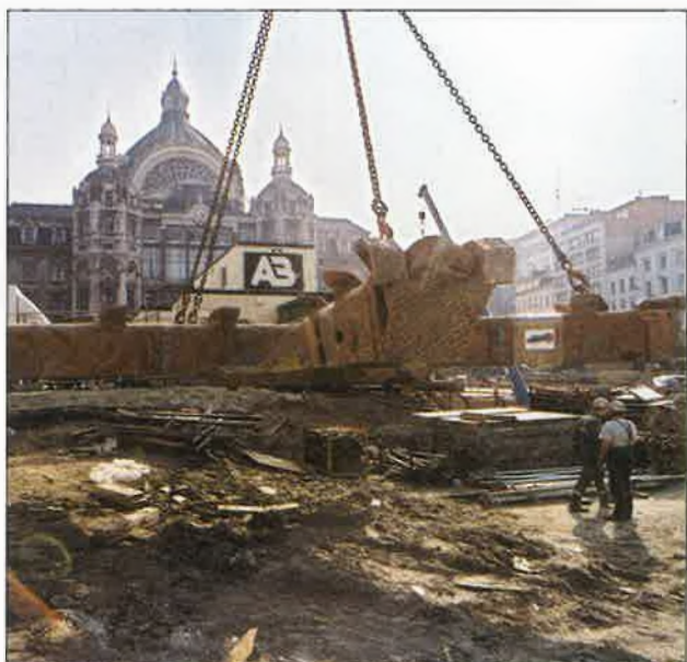
Het boordschild werd volledig gedemonteerd.

680 ton zwaar, keerde achterwaarts via de geboorde tunnel terug naar het startpunt.