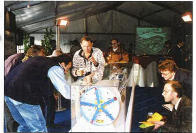
De maquette van het boorschild kon rekenen op veel belangstelling van de omwonenden.