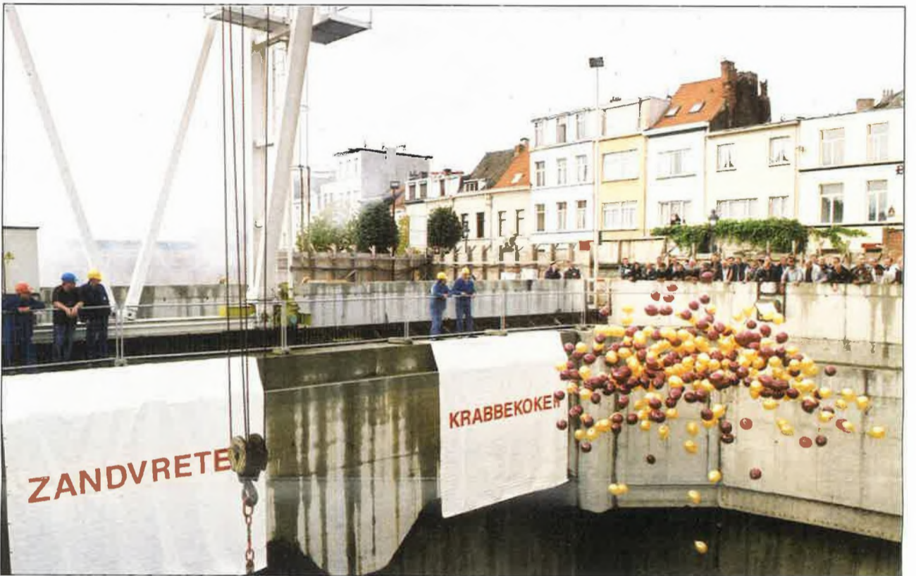
De namen Zandvreter en Krabbekoker worden officieel bekend gemaakt.