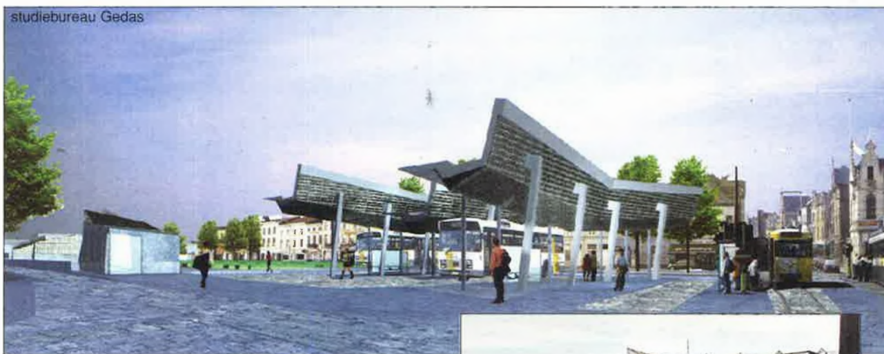
Een impressie van het nieuwe E. Ryckaertsplein, gezien vanaf de Borsbeeksebrug.

Als knooppunt van openbaar vervoer, krijgen ook de bussen de nodige bewegingsvrijheid. Dit betekent dat niet alleen het plein zelf, maar ook