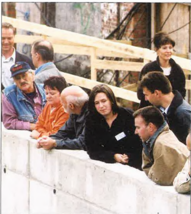
De omwonenden kregen vanuit de vertrekschacht een exclusieve blik op het boorschild dat vertrekkenklaar stond.