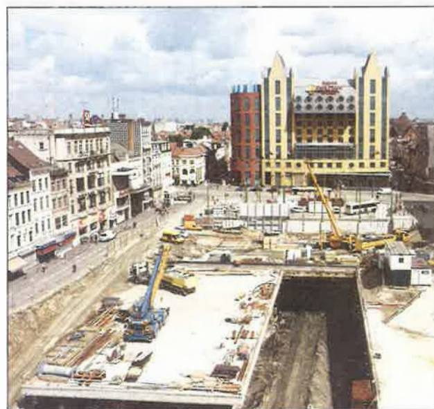
Momenteel wordt gewerkt aan de afwerking van de in- en uitrit van de ondergrondse parking.

Al deze maatregelen zorgen samen voor een betere toegankelijkheid van de stationsbuurt en het Astridplein.