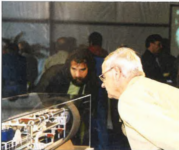
De maquette geeft een goed beeld van hoe de tunnelboormachine werkt. Het sturen gebeurt door middel van hydraulische vizels.