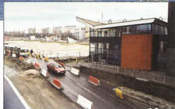
Het E. Ryckaertsplein zal opnieuw een echt plein worden waar het aangenaam is om te vertoeven.

de omliggende straten moeten worden aangepakt. Zowel de Uitbreidingsstraat, Posthoflei als de bushalte van de Gulden Vliesstraat en omgeving zullen een renovatiebeurt krijgen.