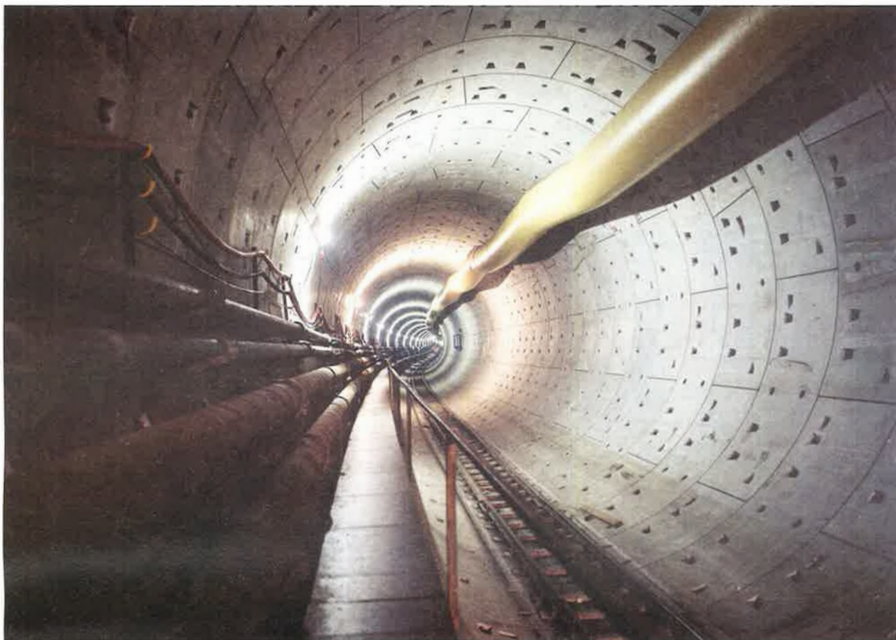
De ruwbouw van de eerste tunnelkoker is klaar. Door deze koker zullen de treinen vanuit Nederland richting Antwerpen sporen.