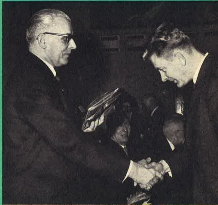
De hh. Ministers, de Beheerders-afgevaardigden van het personeel en de Directeurs feliciteerden ieder op hun beurt de laureaten.