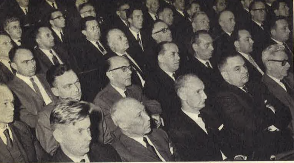
Enkele vertegenwoordigers uit werketzels, laureaten van de wedstrijd...

de spoorman doordrongen is? Hoe lonend was onze vrijwillig aanvaarde tucht! En wat een voorbeeld voor de gemeenschap die door de groeiende onveiligheid van de weg beangst wordt!