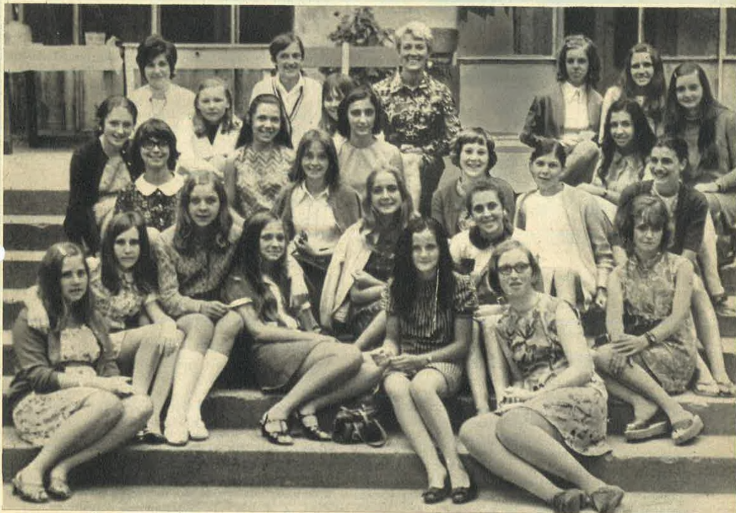
De KAS VAN DE SOCIALE SOLIDARITEIT draagt bij in de ontspanning van onze kinderen in België en in het buitenland.