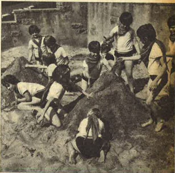
HET UURTJE VAN DE KUNSTENAAR