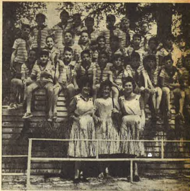
DE « SQUADRA ITALIANA »