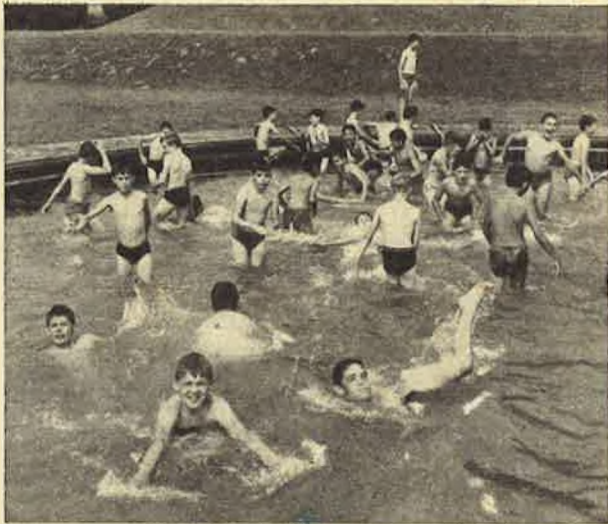
AAN DE KUST ?...