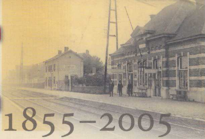
Casernen - Binnen statie Station Interieur