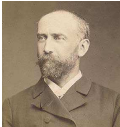
Architect Franz Seulen tekende het plan van het goederenstation Antwerpen-Zuid in 1901.

Seulen behield de neoclassicistische stijl van het oude gebouw. Om ruimte te maken voor de verruimde kaaiavlake, werd een schuin stuk van het bestaande gebouw weggesneden. Dat is nu nog zichtbaar aan het grondplan van de huidige patio die vroeger het kantoorgedeelte van het goederenstation vormde.