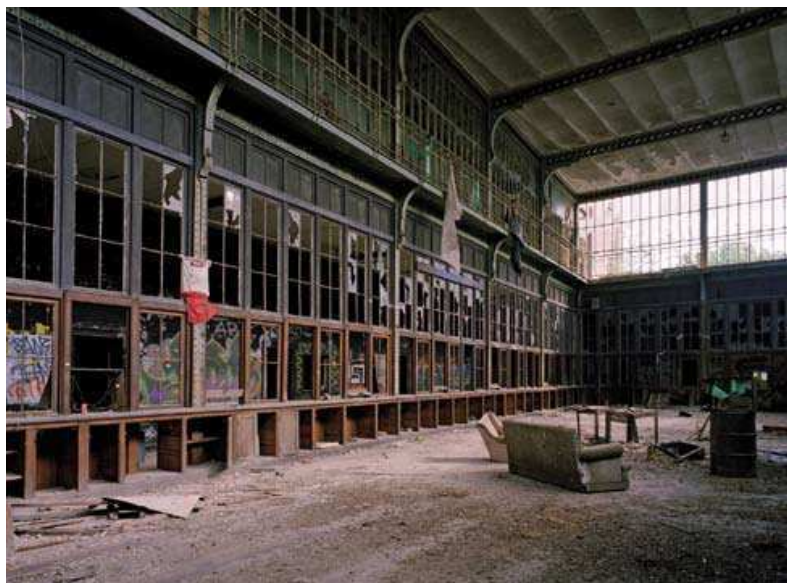
Voormalige lokettenzaal, zomer 2004.

In het voorjaar van 2004 was Bank J. Van Breda & C o al enige tijd op zoek naar een geschikte locatie voor haar nieuwe zetel. De Vanbreda building op de Plantin & Moretuslei was door expansie te klein geworden. De bank besloot daarop te verhuizen, maar wilde een gebouw met een ziel: een pand met uitstraling waarin zowel personeel als cliënten zich thuis zouden voelen. Geen sinecure, tot het oude Goederenstation-Zuid werd voorgesteld. Ondanks zijn vervalten toestand, was het liefde op het eerste gezicht.