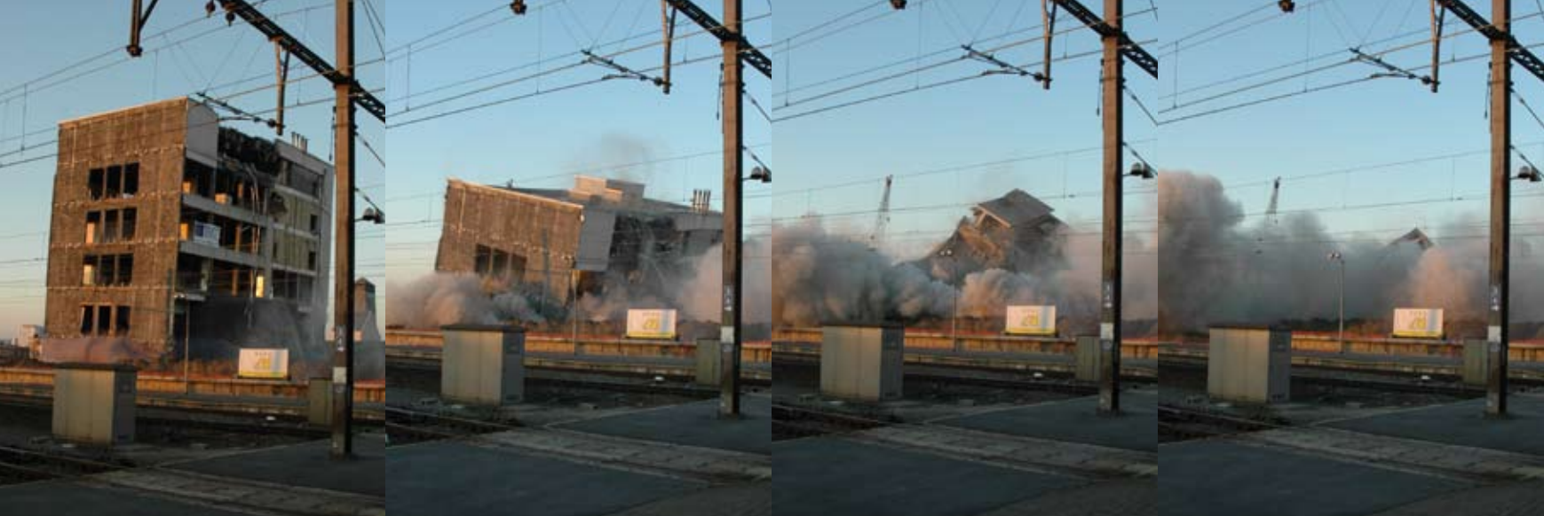
Het opblazen van de oude postgebouwen op 17 en 25 november 2007 duurde enkele seconden, het puin opruimen zes weken.