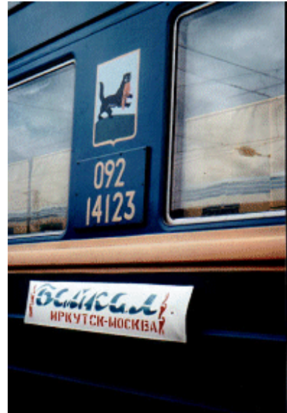
Op de trein zie je het embleem van de Transsiberische Spoorlijn

Maar voordat je in Moskou een kaartje kunt kopen, moet je ervoor zorgen dat je in Rusland mag komen. Mensen die vanuit Nederland met de trein naar Moskou reizen en dan overstappen op de Transsiberische Spoorlijn, moeten hun paspoort bij zich hebben. Ook moeten ze eerst een visum aanvragen voor enkele landen waar ze doorheen moeten: Wit-Rusland, Rusland en soms ook Mongolië en/of China. Wie met het vliegtuig naar Moskou gaat, heeft géén visum voor Wit-Rusland nodig. Reisbureaus waar je een reis langs de Transsiberische Spoorlijn kunt boeken, kunnen de visa voor je aanvragen. Je kunt ook visa aanvragen bij een visumbureau of bij een ambassade of consulaat van de landen waar je doorheen wilt reizen. Ten slotte moet je naar een wisselkantoor om euro's voor dollars te wisselen. Die heb je onderweg nodig om eten en andere dingen te kopen.