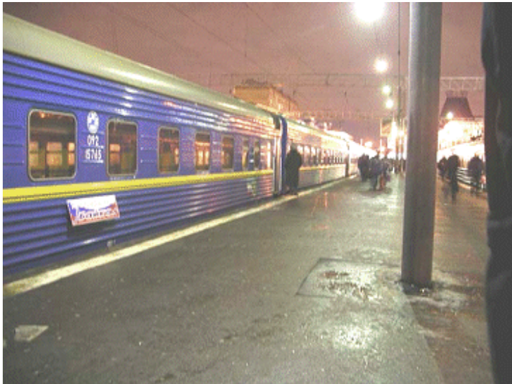
De trein staat in Moskou klaar voor vertrek