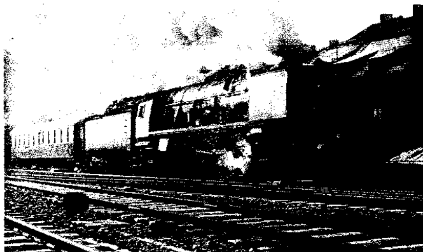
Locomotive « Pacific » type 1 - (série construite à partir de 1935)