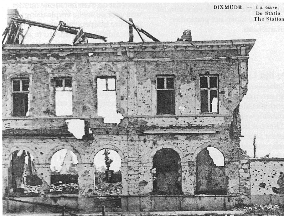
DIXMUDE — La Gare. De Statie The Station.