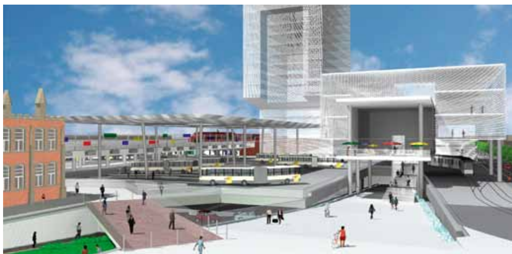
De groene helling en de stenen helling ernaast leiden naar de ondergrondse zoenzone. Er boven zie je het busstation.

Duurzaamheid is meer dan een rol isolatie hier en een zonnepaneel daar. Het project Gent Sint-Pieters tast vandaag de grenzen af van wat morgen mogelijk wordt.