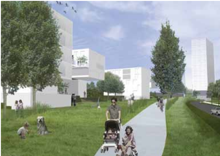
Wonen in een parklandschap. Rechts loopt de K. Fabiolalaan, achter de woontoren ligt de Snekkaai.