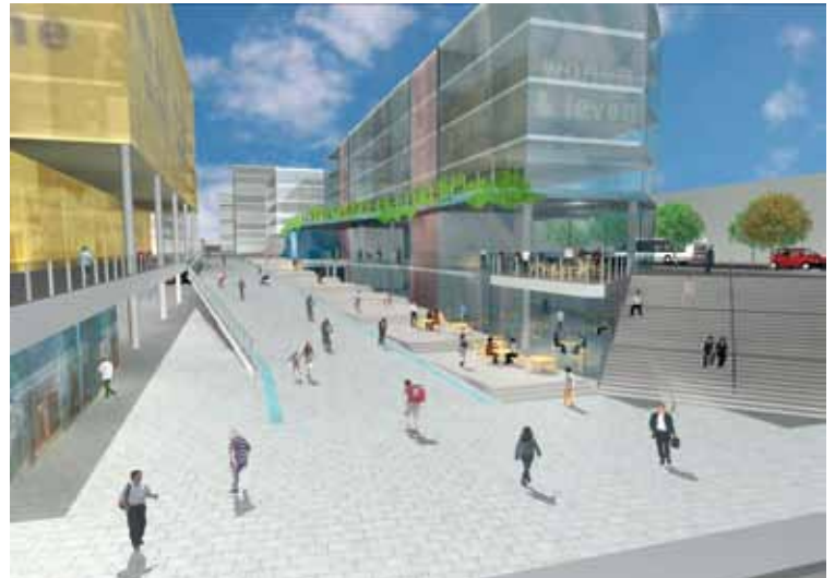
Werken en winkelen bovenop de parkeergarage. De trap rechts leidt naar de K. Fabiolalaan.