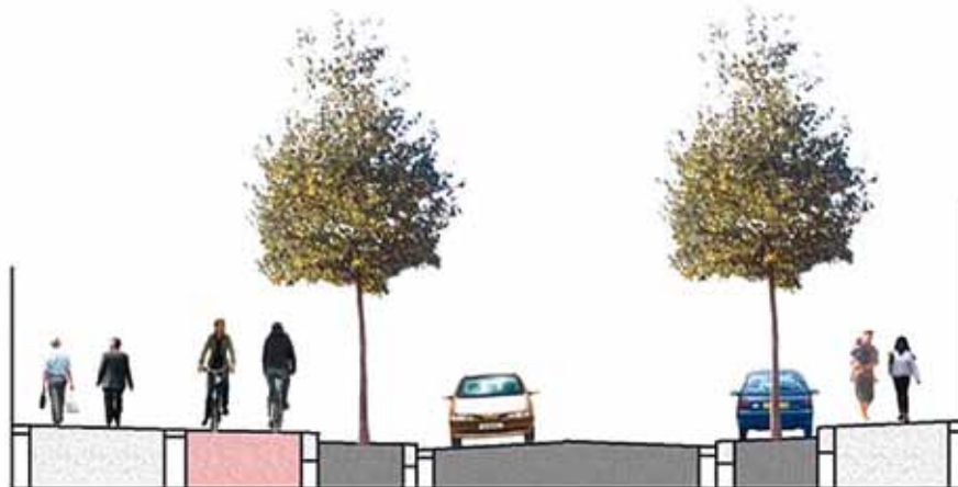
Doorsnede van de verbrede K. Fabiolalaan, kijkend in de richting van de Snekkaai.