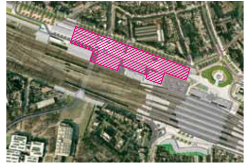
De SOFAzone komt bovenop de parkeergarage en wordt als eerste van de drie zones ontwikkeld.

De jury, onder voorzitterschap van oud-burgemeester Frank Beke, selecteerde vijf ontwerpteams. Die maakten een inrichtingsplan voor de SOFAzone en een schetsontwerp voor een eerste slanke kantoortoren. Belangrijke