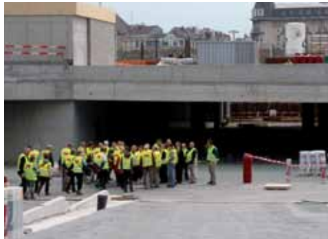
15 en 16 oktober: 900 werfbezoekers welkom

Om dit scharniermoment in het project Gent Sint-Pieters te vieren, nodigen de projectpartners u op vrijdag 15 en zaterdag 16 oktober opnieuw uit voor een werfwandeling. Je kunt mee op 6 verschillende tijdstippen en er is plaats voor 900 bezoekers! Mooi meegeenomen: omdat de hele verhuisbeweging dan nog moet gebeuren, maak je in alle rust kennis met de tunnels, het bus- en tramstation en de pendelparking.