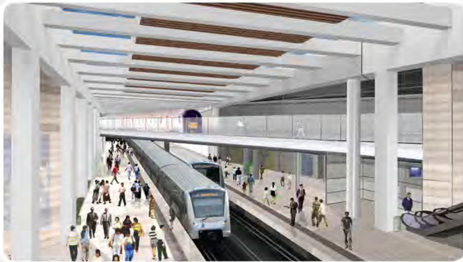
© Bureau d'étude W.J. & M.C. Van Campenout s.a. en collaboration avec AREP, France - Studiebureau W.J. & M.C. Van Campenout n.v. in samenwerking met AREP, Frankrijk

Ces travaux apporteront un nouveau confort en matière de mobilité à tous ceux qui vivent ou travaillent à Bruxelles !