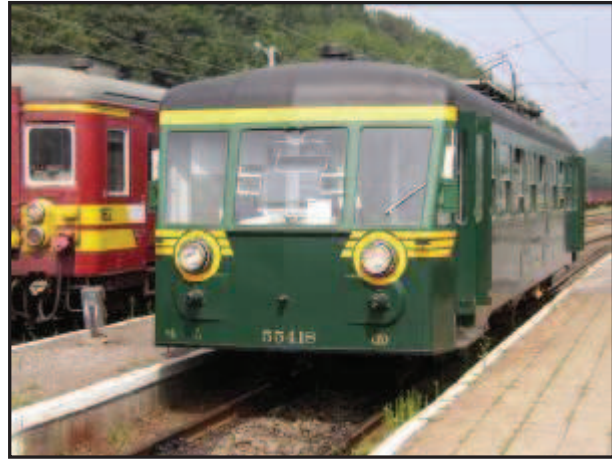
AUTORAIL EX-SNCB 554-18 EN GARE DE CINEY LE 01 AOÛT 2004

Il y a un peu plus d'un siècle était mise en service la ligne 128 entre Ciney et Yvoir. Considérée comme l'une des plus belles sections de chemin de fer de Belgique de par son inscription dans la vallée du Bocq et la présence de nombreux ouvrages d'art (viaducs, tunnels, ponts), cette ligne fait actuellement l'objet d'une étude de remise en service par l'asbl Patrimoine Ferroviaire Touristique.