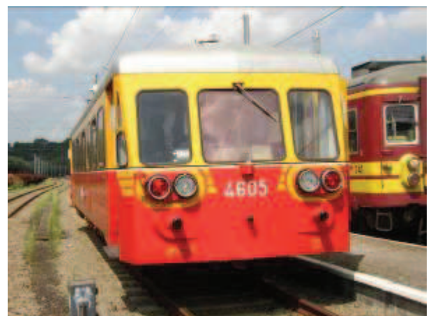
LE SECOND AUTORAIL EX-SNCB 4605 APPARTENANT AU PFT ASBL ET MIS EN SERVICE SUR LA LIGNE 128 LORS DE LA BROCANTE DE SPONTIN. GARE DE CINEY : LE 1 ER AOÛT 2004.

Après la seconde guerre mondiale, les trains de voyageurs étaient assurés par des autorails (type 551 et 553) entretenus par la remise de Ciney. Quant aux convois de marchandises, ils