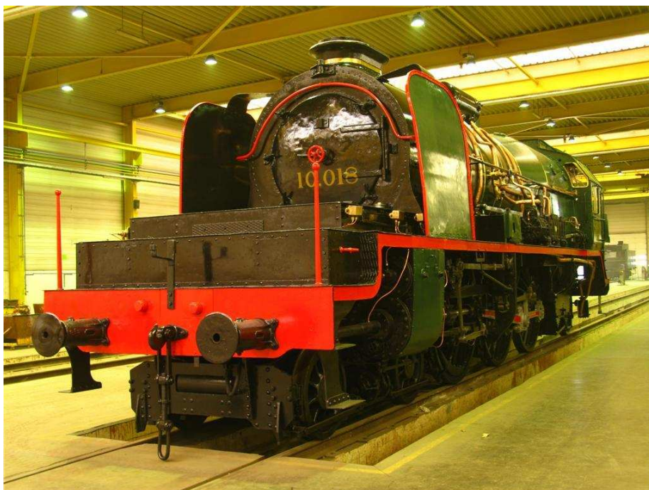
La type 10, restaurée.

La Locomotive 10.018 est un autre « monstre » des collections de la SNCB-Holding. Elle était destinée, de par sa puissance, aux lignes « à relief » et principalement aux trains express vers le Luxembourg et Werkenraedt. Conçue par l'ingénieur des Chemins de Fer de l'Etat belge, Jean-Baptiste Flamme et série construite entre 1910 et 1914, la locomotive type 10 est lors de sa mise en service la plus puissante (2268 CV) du continent européen. Elle est la reine de la ligne du Luxembourg et de Verviers. Elle a été construite dans les ateliers Cockerill à Liège. La 10.018 de la SNCB-Holding est le dernier exemplaire existant des 58 locos de ce type construites en Belgique. Elle a roulé jusqu'au 30 décembre 1956.