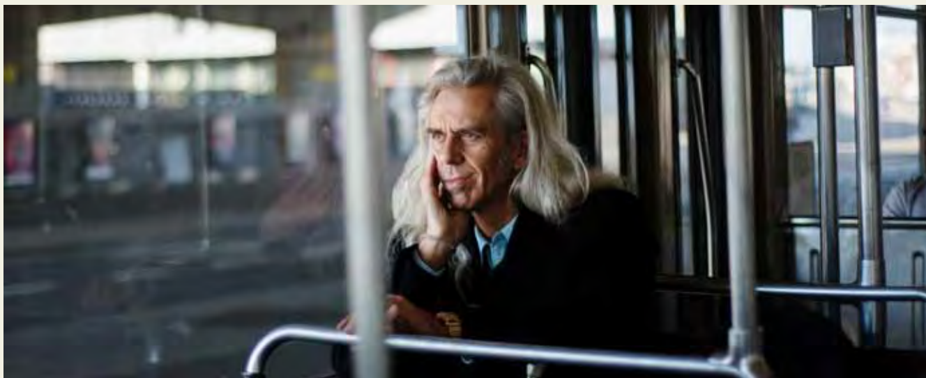
Foto: Guido Belcanto poseert voor de TreinTramBuskalender

De derde promotiecampagne die TreinTramBus tot een goed einde heeft gebracht, was het ontwikkelen en publiceren van een BV-kalender. Aan deze BV kalender hebben onder andere Sarah Ferri, Nic Balthazar en Eva Brems meegewerkt. Er is een online kalender uitgewerkt met weetjes en tips (zie www.treintrambuskalender.be ).