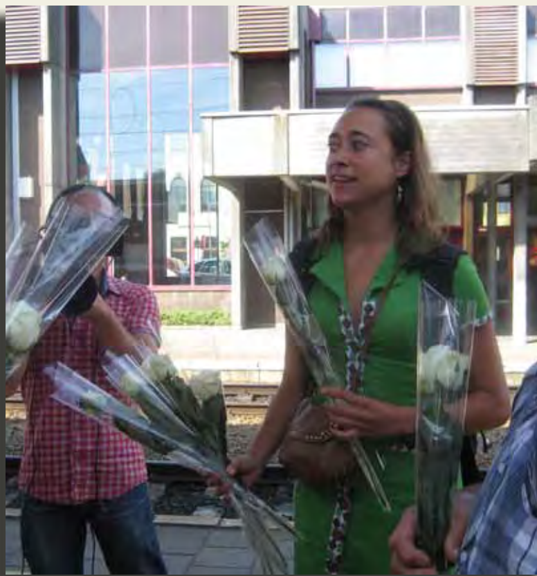
Foto: Beloningsactie aan het station van Zottegem

De samenwerking met de verschillende partners binnen de spoorlijncomités verliep ook in 2012 goed. Daarnaast werd ook de band met de gemeentes en steden die langs de spoorlijnen lopen, aangehaald. Dankzij de steun van provincie Oost-Vlaanderen groeiden de spoorlijncomités uit tot hét overlegorgaan bij uitstek voor de spoorlijnen Gent-Ronse en Gent-Geraardsbergen. Bij alle acties staan de belangen van de pendelaars voorop.