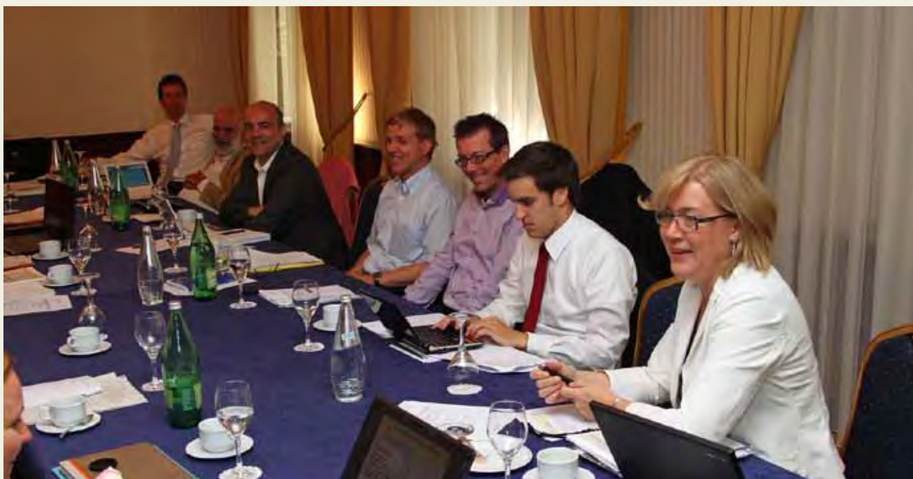
Consortium meeting USEmobility in Zagreb, september 2012

Op basis van deze enquête heeft TreinTramBus in 2012 6 workshops in heel Europa gehouden om de experts in de verschillende landen te confronteren met de resultaten en hun visie hierop te geven. Dit heeft dan uiteindelijk geresulteerd in strategische aanbevelingen voor zowel overheden, operatoren als het middenveld. Het project USEmobility wordt in februari 2013 afgesloten met een grootschalige eindconferentie in Berlijn.