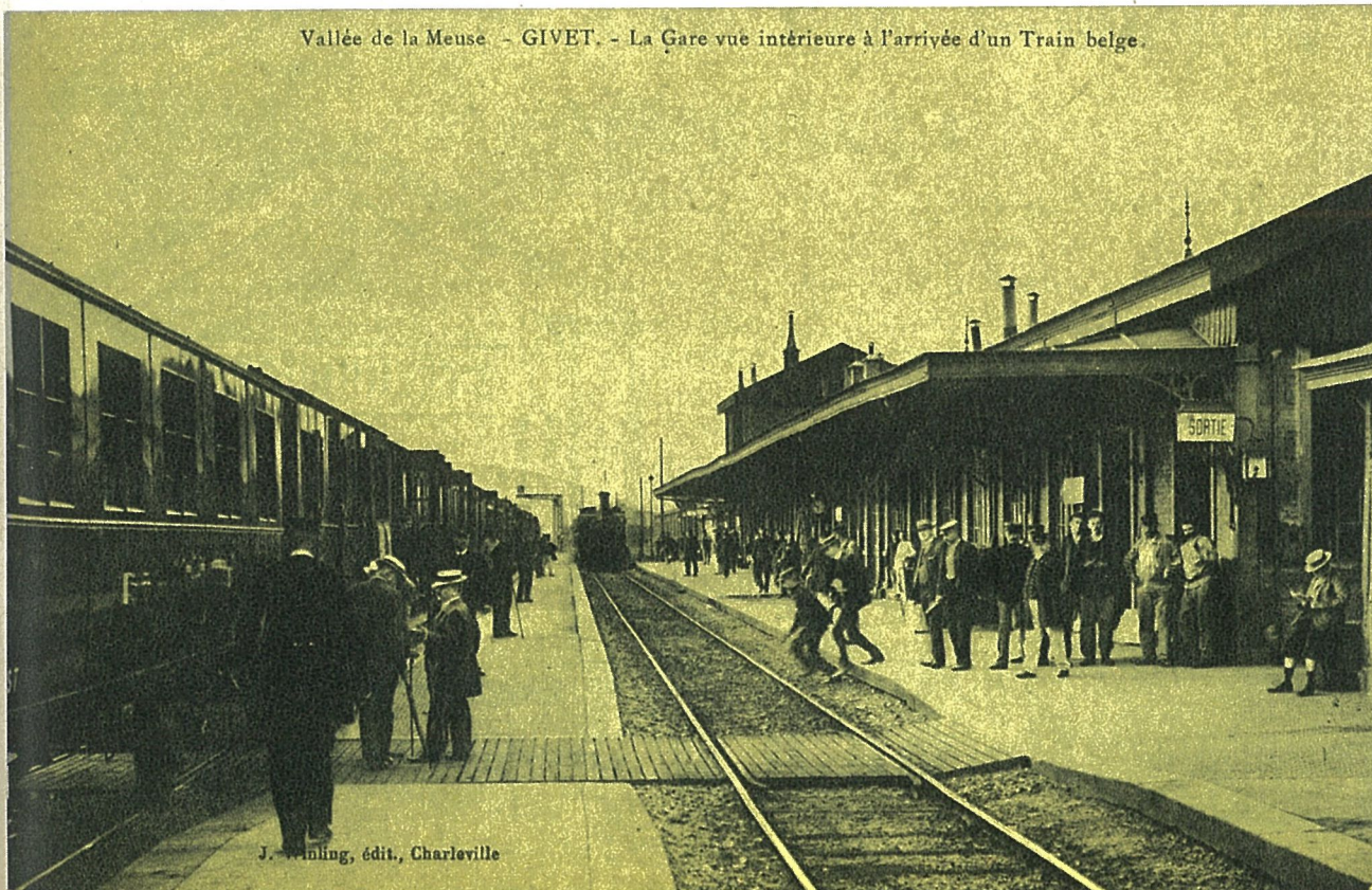
Vallée de la Meuse. - GIVET. - La Gare vue intérieure à l'arrivée d'un Train belge.

Op foto 2 bevinden we ons te Givet. Het is 17 u. 50 en een fluittoon weerklinkt : de trein 2050 komende van Doische rijdt langzaam het station binnen. De aansluiting voor Mézières van de « Compagnie de l'Est français » wacht rustig op het naastgelegen spoor. De bedienden lopen druk doende langs het stel terwijl twee reizigers, uitgedost met een strohoed en paraplu, een levendig gesprek voeren. De kaartjesafnemer wacht op de reizigers aan de uitgang terwijl een jongeling zich verdiept in een avonturenboek en derhalve niet de minste aandacht heeft voor de drukte in het station. Een bediende vergezelt een haastige reiziger ; niettegenstaande een trein in aantocht is, steken zij de sporen over en vergeten zij de houten spoorovergang te gebruiken. Wat zeggen de huidige voorschriften van het veiligheidsboekje hierover ?