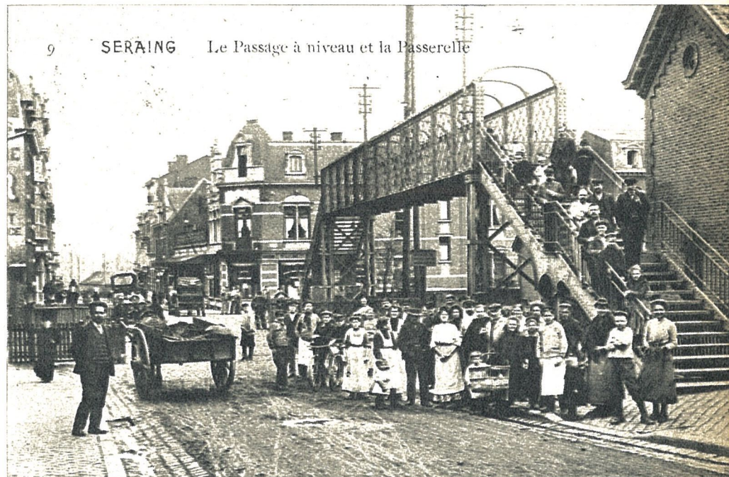
9 SERAING Le Passage à niveau et la Passerelle