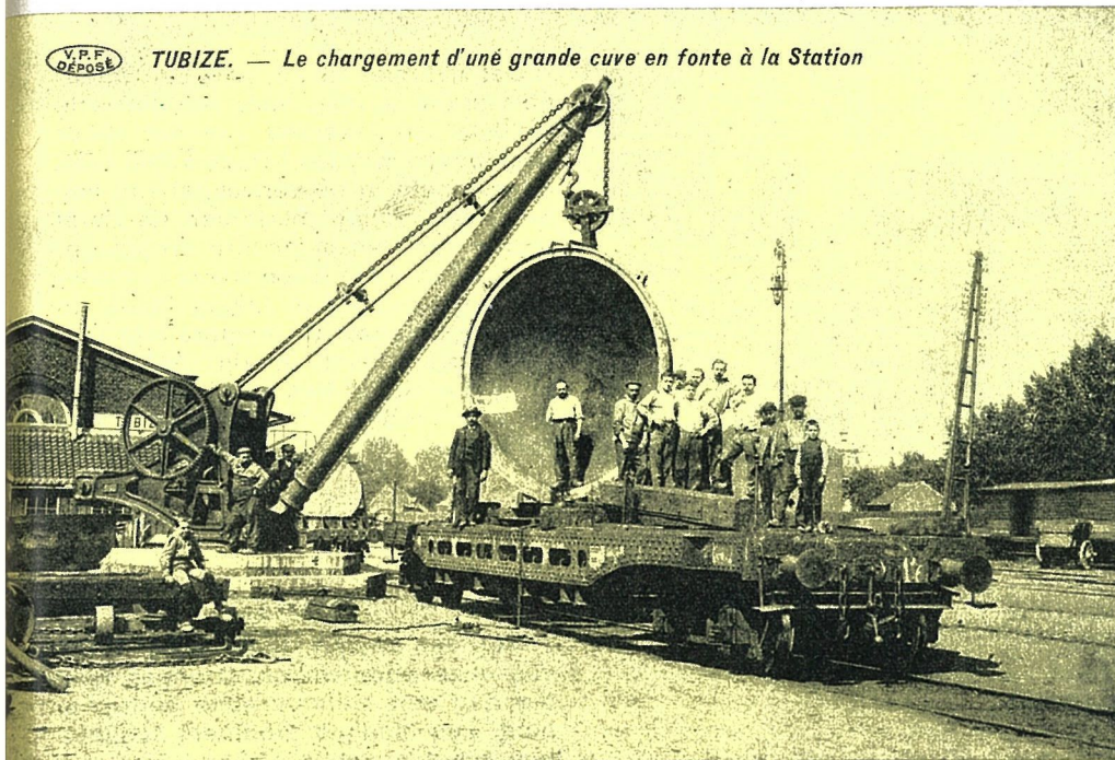
V.P.F. DÉPÔSE TUBIZE. — Le chargement d'une grande cuve en fonte à la Station

In Tubeke wonen we het laden bij van een grote gietijzeren kuip op een indrukwekkende platte wagen met draaistellen. Ofschoon het station over een krachtige mechanische hijskraan beschikte, dienden heel wat vakbekwame bedienden bij deze delicate operatie behulpzaam te zijn. Bij zijn aankomst op de goederenkoer bezorgde onze reizende fotograaf de werklieden een ogenblik verpozing toen hij ze even kiekte aan de voet van het voorwerp dat hen heel wat last berokkende.