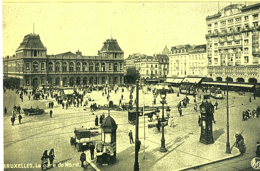
BRUXELLES. La gare du Nord

Zelfs voor een kroniekschrijver kan de boog niet altijd gespannen zijn. Bovendien heeft, zoals we reeds zegden, ook de historiciteit haar rechten. Trouwens, in dat opzicht is er blijkbaar weinig veranderd in de zeden en gewoonten. Ook op onze dagen blijven de stations attractiepolen voor het vestigen van gelagkamers en eetgelegenheden. Ze zullen het wel blijven zolang de mens enkele ogenblikken te verliezen heeft en toevallig op dat moment zijn dorst wil lessen. Voorlopig hoeven de reizigers in elk geval nog niet te wanhopen, want zeventig jaar later zijn er drieëntachtig stations met buffet, waarvan ongeveer een vierde zijn klanten kan « restaureren »