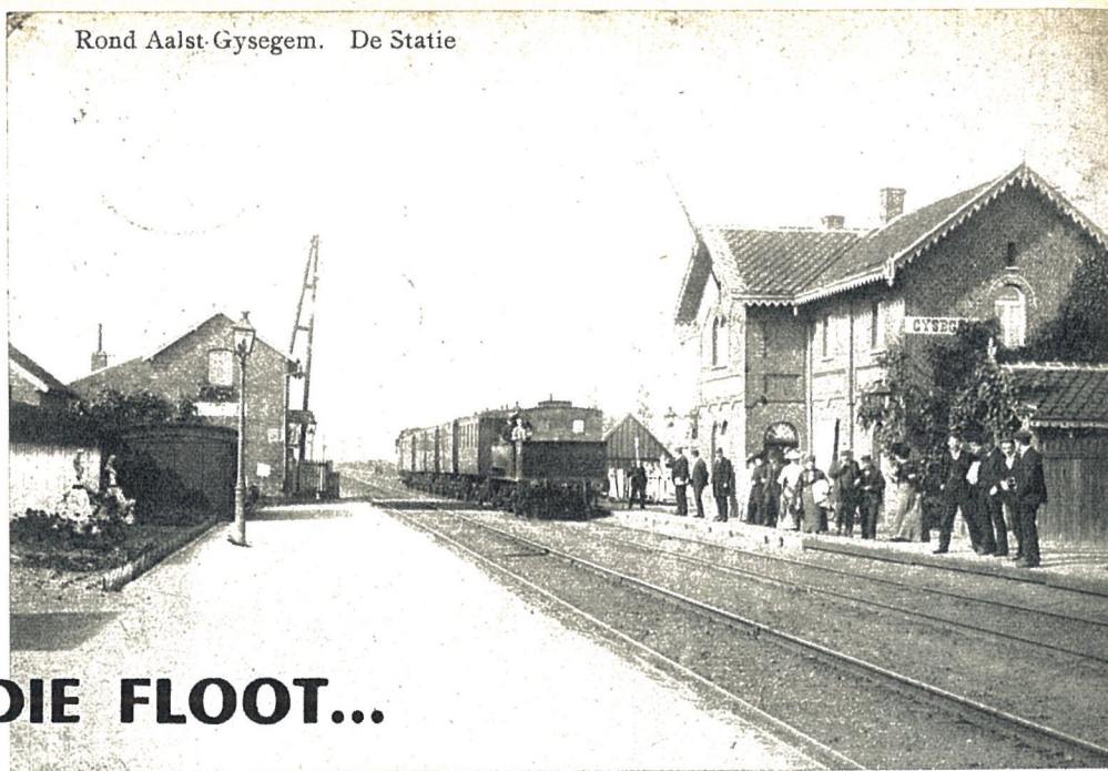
Rond Aalst-Gysegem. De Statie