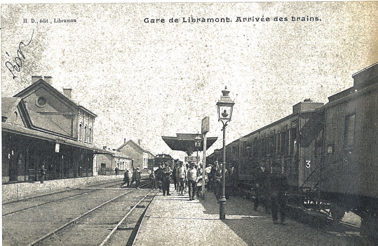
Gare de Libramont. Arrivée des trains.