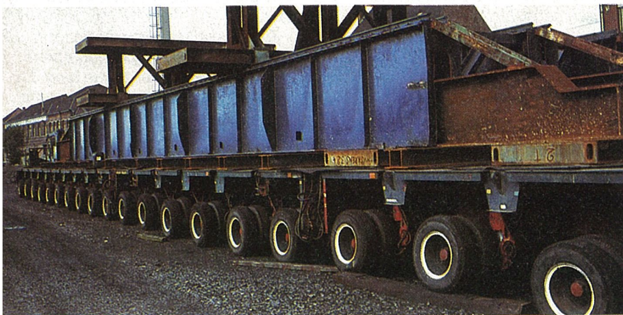
daarna reed ze gewoon weg op een stel wagens.

o onze voorpagina : Platformwagen met ingebouwd hydraulisch systeem