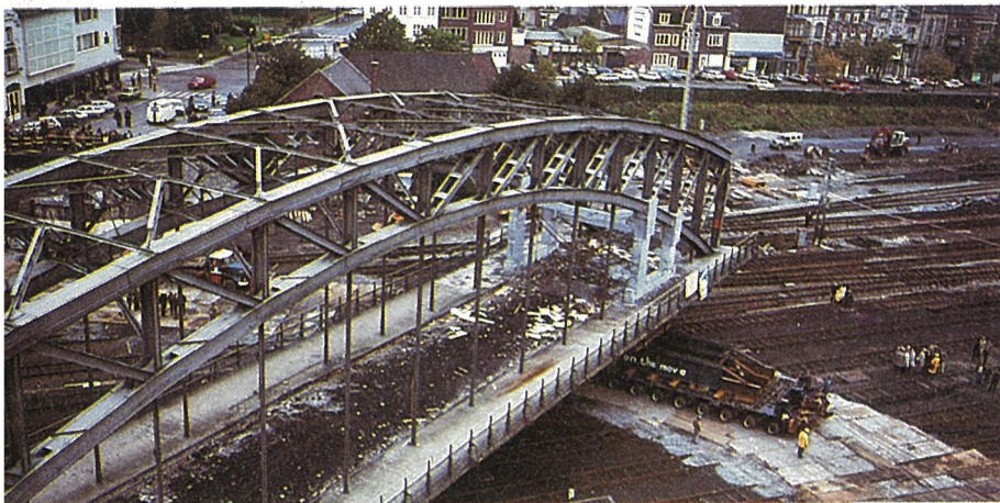
tot ze op een goeie dag gelicht werd en een draai van 90° maakte,