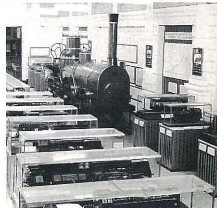
HET MUSEUM IN HET OUDE BRUSSEL-NOORDSTATION

Het spoorwegmuseum te Brussel-Noord is gratis toegankelijk van maandag tot vrijdag, en de eerste zaterdag van elke maand. Telkens van 9 tot 16.30 u. Het museum is gesloten op de andere zaterdagen, de zon- en de feestdagen.