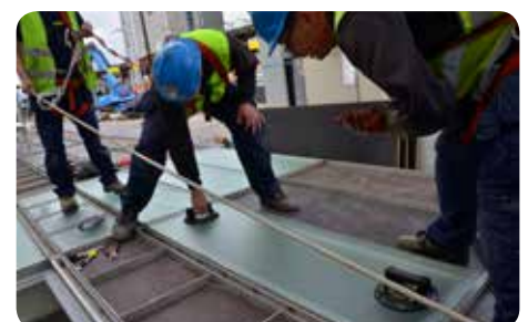
Plaatsen van de vloer in de inoxkaders