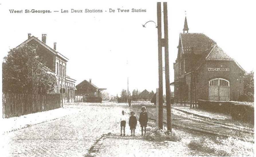
Weert St-Georges. — Les Deux Stations - De Twee Staties

Een unieke tentoonstelling over trein en tram in Weert vanaf 18 februari 1855