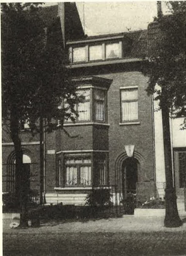
Arch. Dothée — Maison construite à l'intervention de nos institutions

Les dispositions légales existant en faveur des citoyens en général, étaient uniquement applicables aux personnes de la classe peu aisée. Or, il y avait au Chemin de fer un grand nombre d'agents qui ne réunissaient pas les conditions