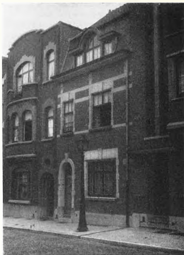
Arch. Dothée - Maison construite à l'intervention de nos institutions

Les tableaux III et IV font apparaître pour les années 1935 à 1938 la répartition des prêts hypothécaires consentis :