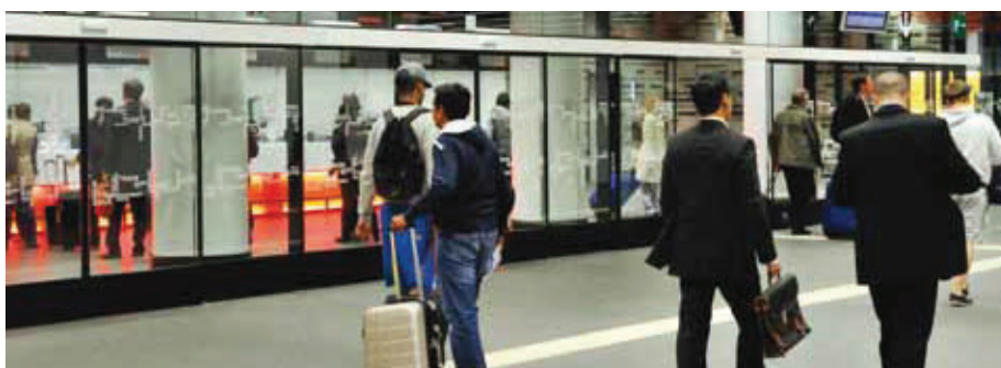
La gare de Bruxelles-Aéroport-National a reçu de nouveaux guichets plus spacieux.

et une deuxième connexion, sur la même ligne, à hauteur de Schaerbeek. Ces tronçons devraient, respectivement, entrer en service fin 2015 et fin 2016. D'autres projets ont également une influence